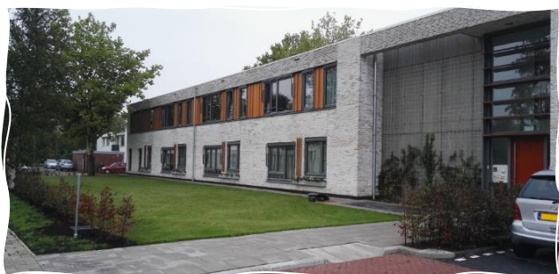
Afbeelding: Futurahuis Boskoop

De locatie van Futura Zorg aan het Klaverblad 47 in Boskoop, is gelegen in het Groene Hart tussen Alphen aan den Rijn en Waddinxveen. Het Futurahuis staat in een ruim opgezette woonwijk met veel groen.