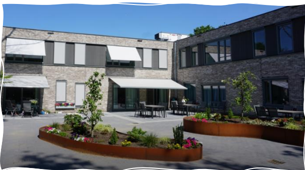
Afbeelding: Futurahuis Den Bosch

Het Futurahuis aan de Meester van Merwicklaan 38 in Den Bosch, is gelegen in de bestaande woonwijk Maaspoort aan de rand van Den Bosch en prachtig verscholen in het groen.