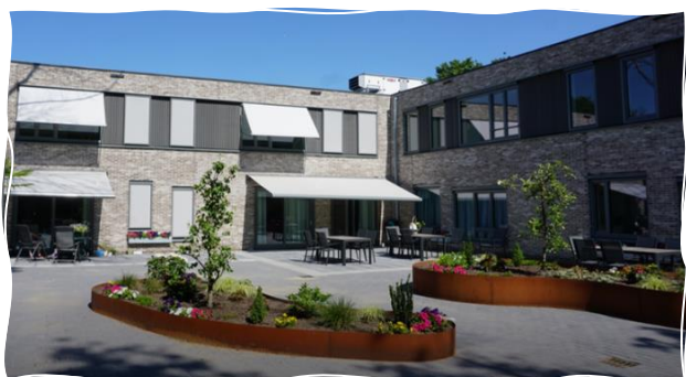
Afbeelding: Futurahuis Den Bosch

Het Futurahuis aan de Meester van Merwicklaan 38 in Den Bosch, is gelegen in de bestaande woonwijk Maaspoort aan de rand van Den Bosch en prachtig verscholen in het groen.