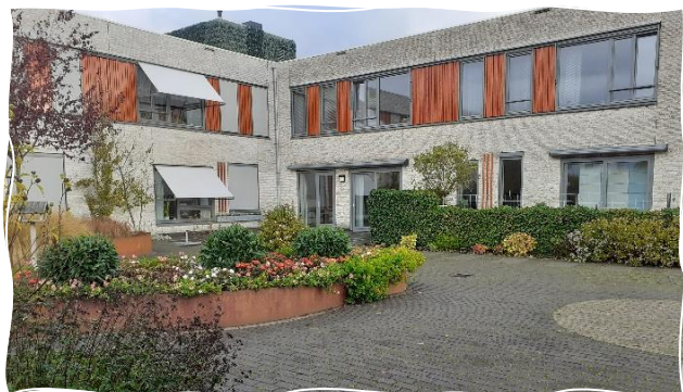
Afbeelding: Futurahuis Nieuwveen

Het Futurahuis in Nieuwveen, aan Parkzicht 1a, is gebouwd in het plan 'De Verwondering' en ontwikkeld met bijzondere aandacht voor het landschap en duurzaamheid. Het gebied kenmerkt zich door haar prachtige landelijke ligging. Het Futurahuis biedt plaats aan 17 alleenstaande ouderen en 1 ouderenechtpaar.