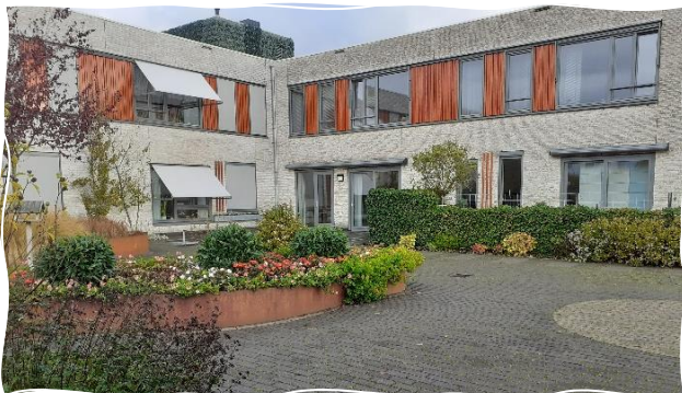
Afbeelding: Futurahuis Nieuwveen

Het Futurahuis in Nieuwveen, aan Parkzicht 1a, is gebouwd in het plan 'De Verwondering' en ontwikkeld met bijzondere aandacht voor het landschap en duurzaamheid. Het gebied kenmerkt zich door haar prachtige landelijke ligging. Het Futurahuis biedt plaats aan 17 alleenstaande ouderen en 1 ouderenechtpaar.