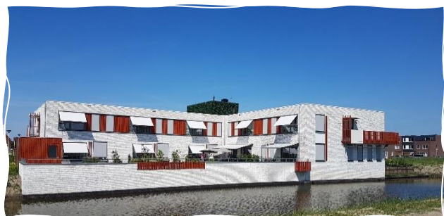
Afbeelding: Futurahuis Oud-Beijerland

Het Futurahuis in Oud-Beijerland is gelegen aan de Vleugel 50, aan de zuidrand van het dorp in de nieuwe wijk Poortwijk III. Een wijk met hoog voorzieningenniveau in de directe omgeving en die direct aansluit op al bestaande woonwijken.