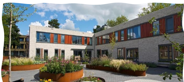
Afbeelding: Futurahuis Oudewater

De locatie van Futura Zorg in Oudewater is gelegen aan de C. Valeriusstraat 7, in een rustige woonwijk in de nabijheid van het centrum maar ook in de buurt van mooie natuur.