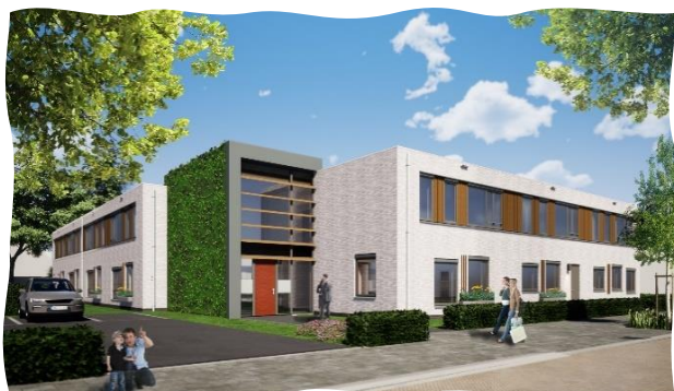
Afbeelding: impressie Futurahuis Someren

De nieuwe locatie van Futura Zorg in Someren is gelegen aan de Geldestraat 9-11, in een rustige, bestaande woonwijk op loopafstand van het gezellige dorpscentrum.