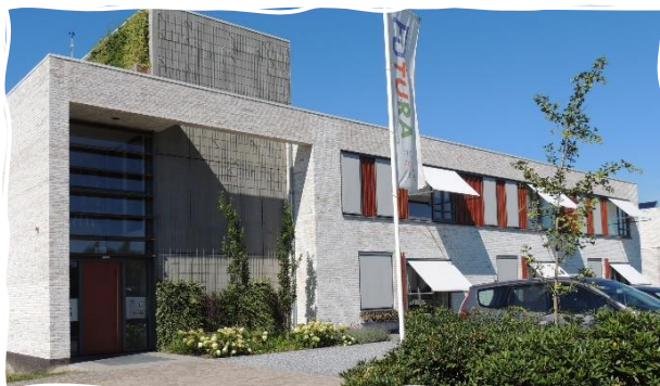
Afbeelding: Futurahuis Waalwijk

Het Futurahuis Waalwijk (Sprang-Capelle) is gelegen aan de Cypressenlaan 15, in de nieuwe wijk De Bibliotheek aan de rand van de oude kern Sprang, op de hoek van de verbindingsweg Oudestraat. Dit Futurahuis biedt plaats aan 19 bewoners.